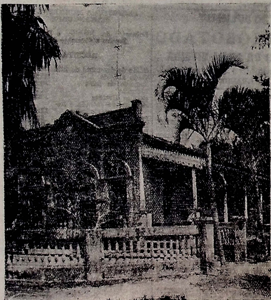
Prédio onde funcionará este anno o INTERNATO.