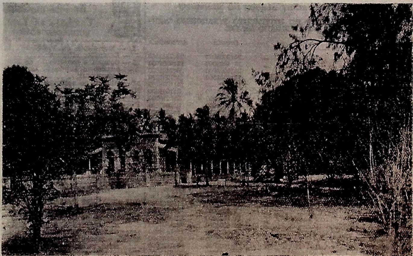
Vista geral do sitio onde será construido o INSTITUTO.