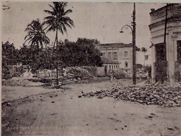
Trabalho de alargamento e calçamento na rua da Palmeira

Mas a nossa capital, com uma população urbana e suburbana de uns oitenta mil habitantes, já começou a experimentar o con-