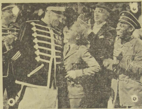
UMA SCENA DE "DEVOÇÃO DE PAE"