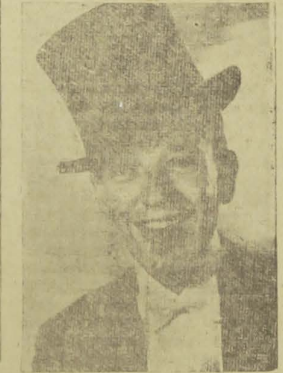
Fred Astaire que hoje deliciará os "fans" do "Rex" em quadras, na qual veremos o par querido de todos os "fans", Fred Astaire e Ginger Rogers, — os reis do ritmo.

"Rex" — O "Rex" vai viver, a partir de hoje, um dos seus grandes dias, com a apresentação da excellente comedia musicada "Nas aguas da