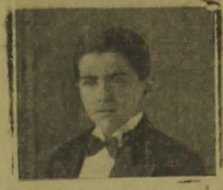
N. B. B. escreve:

“Presados Sr. — Ouvindo grandes propagandas sobre o preparado BONOLEO resolvi experimental-o. Algumas pessoas diziam que era bom para anemia, que fazia engordar. Logo na primeira caixa senti os bons efeitos. O appetite que ha muito não tinha, reapareceu, e com elle a alegria e o bem estar. Com a terceira caixa engordei 4 kilos e muito satisfeito faço-lhe esta declaração espontaneamente. Recebi hoje a caneta-tinteiro, chegando esta em perfeito estado. Junto a esta envio a minha photographia, quando terminei a 3.ª caixa do precioso BONOLEO. Respeitosas saudações”.