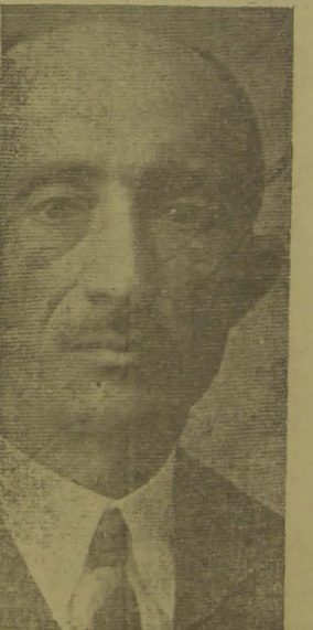
DEPUTADO JOSÉ MACIEL

lativa do Estado o deputado José Maciel, pelo apuro e serenidade confirmou plenamente as suas qualidades de homem publico, integrado nos deveres do mandato que lhe confiou o Partido Progressista da Parahyba.