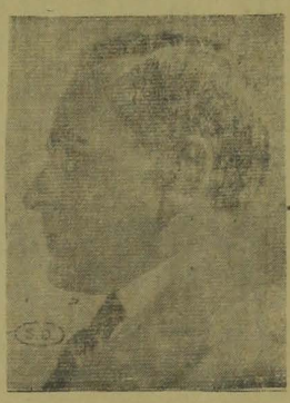
Presidente Getúlio Vargas