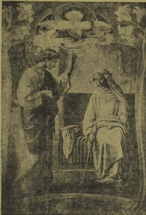
AVE, MARIA, CHEIA DE GRAÇA!

Sobrepujando, pela sua divina simplicidade, as mais bellas e mais augustas concepções do espirito humano, apparece' nos céus de Bethlem, em noite alta, esta legenda eterna: Gloria in excelsis Deo et in terra pax hominibus bonae voluntatis.