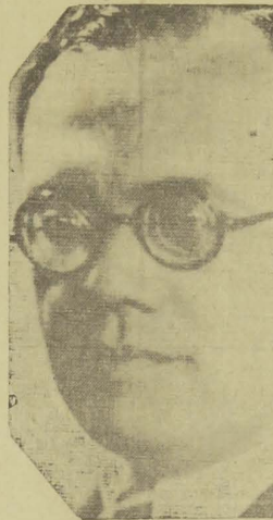
Ministro José Americo

RIO, 5 — (A UNIÃO) — O "Diario de Noticias" diz-se bem informado que o ministro José Americo é candidato à presidencia da Republica, acreditando que o mesmo pôde contar com todo o Norte. (A. B.)