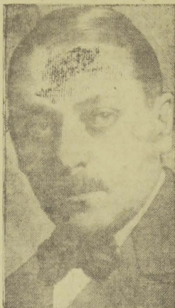
SR. MACEDO SOARES

RIO, 13 (A. B.) — Por falta de accomodações no "Clipper" de sexta-feira, partiu, na madrugada de hoje, destino a Washington, o ex-"chancellor" Macêdo Soares, que vai representar o governo brasileiro na posse do presidente Roosevelt.