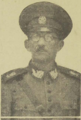
GENERAL NEWTON CAVALCANTI

Falando aos “Diários Associados”, a respeito dos motivos de sua vi-