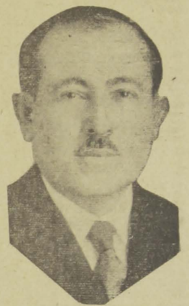
Senador Duarte Lima

dos nossos circulos politicos e figura das de maior actuação no Senado da Republica.