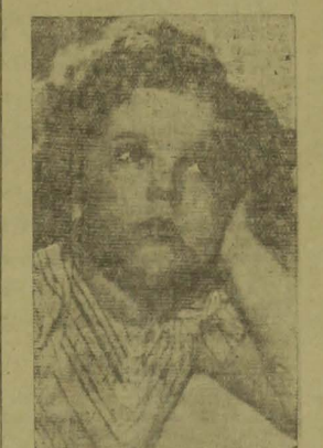
Shirley Temple, "O Anjo do Phareol"

Todos já sabem a quem nos referimos — SHIRLEY TEMPLE. Seu novo