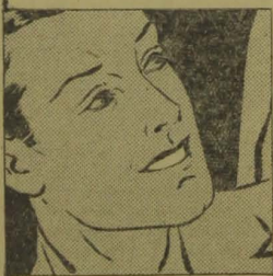
Embelezse seu sorriso com Kolynos

Lembre-se — Kolynos dura o dobro das pastas communs porque basta usar a metade. É tão concentrado que um centimetro sobre a escova secca é sufficiente. Use-o ainda hoje!