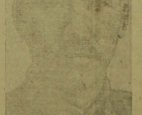
O generalissimo chinês Chiang Kai-shek que opõe tenaz resistencia ás tropas japonesas

OS JAPONÊSES ESTARIAM PREPARANDO UM ATAQUE DEFINITIVO