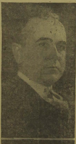
Presidente Getulio Vargas

Serão encerradas, hoje, com grandes festas, a "Semana do Brasil", que se vinha realizan- do, desde o dia 1.º do corrente nesta capital, numa empolgante