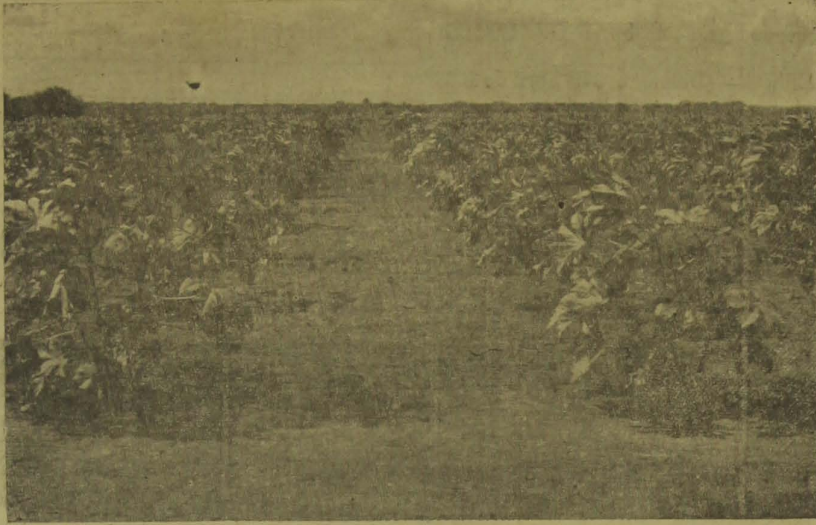
A mamona é uma das esperanças maiores dos lavradores da Paraíba. E é esperança justíssima. Um hectare de mamona bem plantado e em terra boa produz mais de 1.500 kilos de bagas no valor de mais de 800$000, contra uma despesa média de 250$000.

gens e aquedutos, são relativamente barato, por preço perfeitamente econômico.