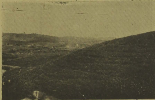
Lindissimo canal cultivado nos morros altos que rodeiam Catende. Ver os regos por onde passam as aguas de irrigação, que com os adubos são responsáveis pelo extraordinario aumento da safra em área de cultura muito menor e muito mais proxima da usina.

As culturas rotineiras desolam; a mesquinhez da safra e pelo aspecto feio da vegetação. A moagem continuava. E a cana moída, em rega pequena e rala, mostrava-se menor do que a atual cana-planta, embora fivesse vinte e dois meses de vegetação, e a segunda apenas quatro, a mais velha.