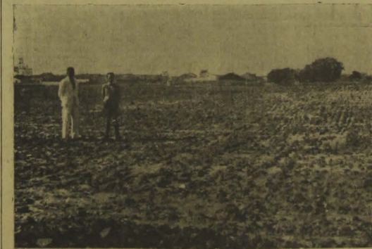
Uma vista do Campo Municipal de Demonstração de Pombal, nos arredores daquela próspera cidade do sertão.

Os beneficios da rotação de cultura são: