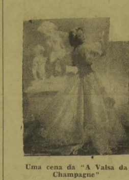
Uma cena da "A Valsa da Champagne"

A estréia, hoje, no "Rex", da "A Valsa da Champagne"