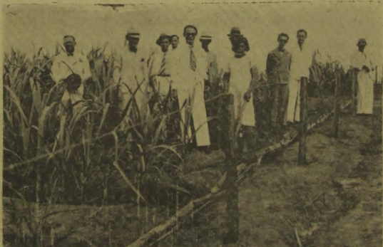
Rega em ladeiras fortissimas pelo método "Herring-bone". A cana, a 70 metros do fundo do vale, mostra-se admiravel embora se estivesse no rigor da estiada.

Catende tem, hoje, mil hectares irrigados. Terá quatro mil no fim deste ano, com a despesa de quatro mil contos de réis. A área irrigada já é bem grande e, em que pese as dificuldades encontradas, principalmente na extrema ondulação do solo que exigiu instalações caras, barra-