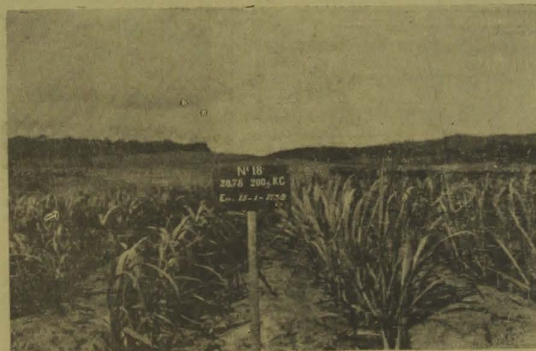
Talhões experimentais de cana de assucar, na Uzina Catende. Cana de pouco mais de dois meses e extraordinariamente vigorosa.

grande fornecedor de madeira de lei para as necessidades nordestinas.