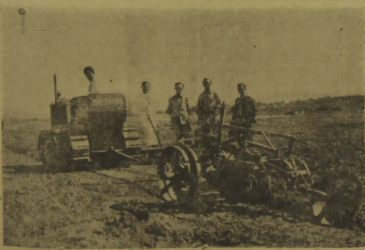
Trator "Allis-Chalmers" da Diretoria de Produção trabalhando em um grande campo de algodão no município de Patos.

Teremos tudo isso. Por que não atingir a meta desejada?