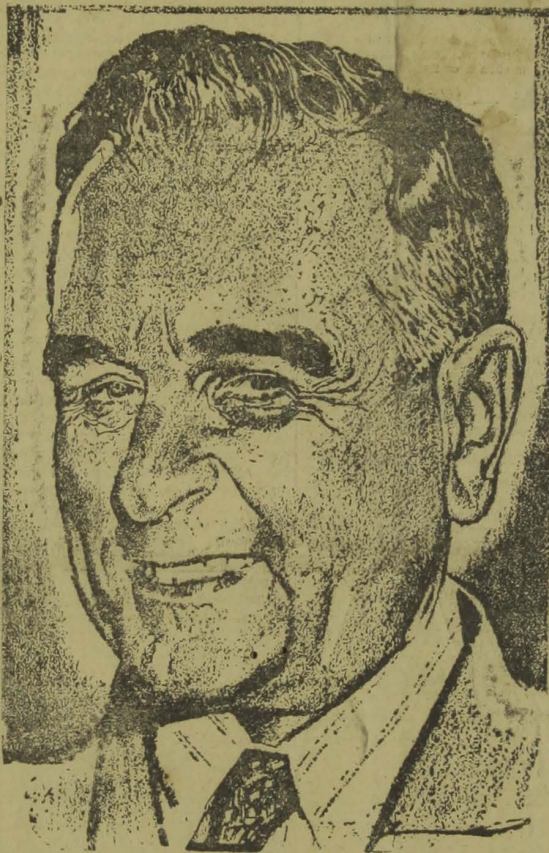
PRESIDENTE GETÚLIO VARGAS

Apesar de vários períodos de agitação por que tem passado o País nestes últimos anos, é inevitável que o governo Getúlio Vargas vem realizando uma notável obra de reconstrução do País. Os nossos índices de progresso são mais altos que em 1930. A vitalidade econômica da Nação, ao sópro da mentalidade nova, dia a dia mais se distende, despertando novos núcleos industriais, animando a iniciativa particular pelo exemplo e incentivo que lhe dá o poder público, congregando as classes produtoras num só objetivo, que é o engrandecimento do Brasil pelo trabalho dentro da ordem. E no que concerne aos interesses agrícolas, o País vem sendo impulsionado por uma larga política de apoio ao labor dos campos, dentro de normas que se enquadram com a nossa ancia de progresso em face da concorrência mun-