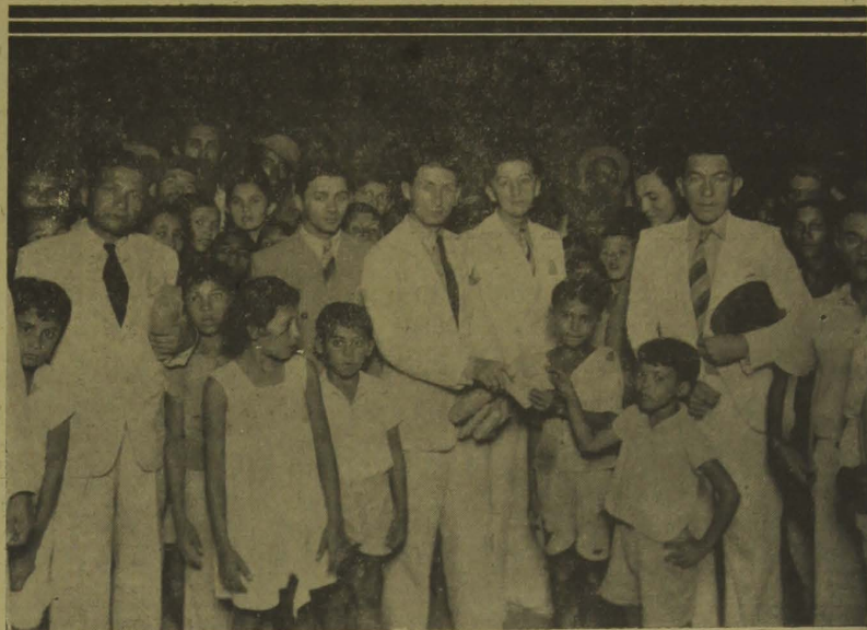
Flagrante da distribuição, ontem, de presentes às famílias dos socios necessitados do Centro Cívico "Argemiro de Figueirêdo"

Realizou-se, ontem, no Centro Cívico "Argemiro de Figueirêdo", de Cruz das Armas, a festa do Natal, que os diretores daquela importante agremiação ofereceram aos seus socios necessitados e que consistiu na distribuição de presentes às respectivas famílias.