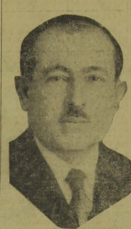
Dr. Duarte Lima

Retornou, ante-hontem, ao nosso Estado, vindo do Rio de Janeiro, o dr. Duarte Lima, ex-senador federal e