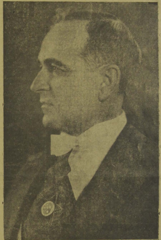
PRESIDENTE GETULIO VARGAS