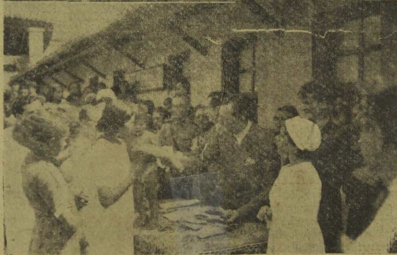
EM CIMA: — O Interventor Argemiro de Figueirêdo e outras pessoas presentes às solenidades do 1.º aniversário da criação da Cozinha Dietética, no momento de iniciar-se a distribuição de prêmios às crianças. EM BAIXO: — Um flagrante do Chefe do Governo, fazendo a entrega do prêmio à criança classificada no 1.º lugar do Concurso de Robustez Infantil.

O Serviço da Cozinha Dietética festejou, ontem, o primeiro aniversário de sua existência. Por esse motivo, realizaram-se ali, expressivas solenidades, que foram prestigiadas com a presença do sr. Interventor Argemiro de Figueirêdo e outras autoridades federais e estaduais.