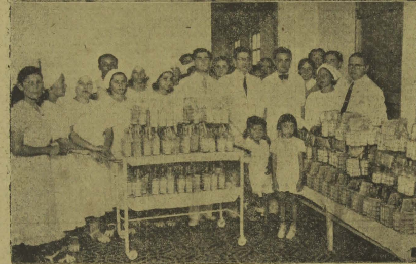
EM CIMA: — Os pequeninos aguardam a sua vez de receberem os presentes. EM BAIXO: — O representante da "A União", em companhia do diretor de Saúde Pública e do chefe do Serviço de Higiene Infantil, visita uma seção da Cozinha Dietética, antes da distribuição de leite às crianças.