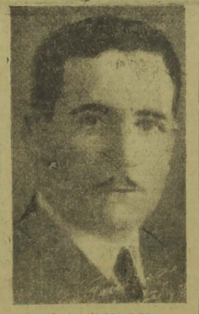
Presidente Alfredo Baldomir

Após a cerimonia de posse, verificou-se grande desfile militar, a cuja fren-