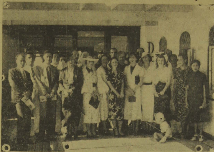
Elenco da Companhia Renato Viana, chegada, ontem, nesta capital

Após a realização de uma vitoriosa temporada no Recife, chegou ontem a esta capital a Companhia teatral dirigida pelo notavel dramaturgo brasileiro Renato Viana, uma das mais vigorosas expressões da arte cênica nacional.