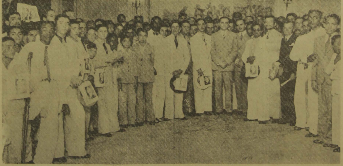
O interventor Argemiro de Figueirêdo entre os operarios que foram testemunhar a s. excia. a sua repulsa pela masórcia integralista e o seu mais decidido apoio e solidariedade ao presidente Getúlio Vargas

A partida, do sr. Interventor Federal e sua comitiva se dará ás 6 horas da manhã, do Palácio da Redenção, devendo estar de volta a esta Capital ás primeiras horas da noite de hoje.