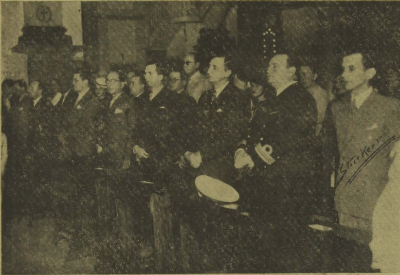
O interventor Argemiro de Figueirêdo quando ante-ontem assistia ao "Te Deum", em companhia de altas autoridades federais e estaduais.

Celebrou-se às 19 horas do domingo passado, na Catedral Metropolitana, o solene "Te Deum" em ação de graças por haver escapado iléso do atentado integralista o presidente Getúlio Vargas.