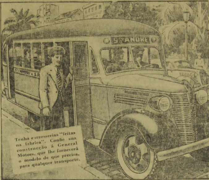
Tenha carrocerias "feitas na fabrica". Confie sua construção á General Motors, que lhe fornecerá o modelo de que precisa, para qualquer transporte.