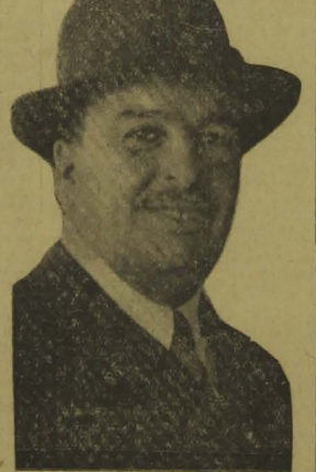
Ministro Sousa Costa

A frente desse importante órgão do Governo da República, vem s.