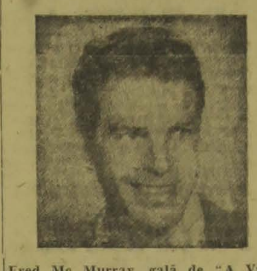
Fred Mc Murray, galã de "A Valsa da Champagne"

O "Rex", no proximo domingo, apresentará ao publico pessoense "A Valsa da Champagne", uma das mais bonitas realizações cinematograficas de Hollywood.