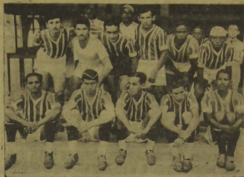
O time do "Pitaguaes" a quem cabe a responsabilidade do jogo de hoje.

Comemorando o dia de hoje, o "Equador" fará uma tarde esportiva bem interessante realizando diversas