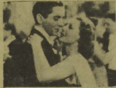
Loretta Young e Tyrone Power, numa cena de "Café Metrópole"

O Rex apresentará, hoje, mais uma excelente cinta da 20th Century Fox, que se intitula "Café Metrópole".