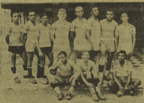
O excelente esquadro do "Felipeia" que vai enfrentar, hoje, à tarde, o "América", de Natal.