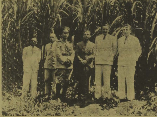
1) Bêlo canal na UZINA São João; 2) Aspecto tirado, por ocasião da visita, ontem, do interventor Argemiro de Figueiredo, aos serviços de irrigação racional de cana de açúcar localizados em terras daquela UZINA e engenho Pacatuba. À esquerda do chefe do Governo, está o dr. Renato Ribeiro

ro de Figueiredo, ainda acompanhados das mesmas pessoas, seguiu com destino a "Pacatuba", grande propriedade do dr. Renato Ribeiro, situada na estrada Sapé-Mamanguape, tendo sido ali recebido pelo dr. João Ursulo Filho, prefeito municipal de Sapé.