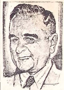
Presidente Getúlio Vargas

RIO, 28 — (A. N.) — Viajando de avião, chegou, hoje, pela manhã, a esta capital, procedente de Belo