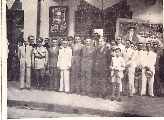
Aspecto apanhado, ontem, no "Rex", anos a exhibição dos "shorts" da "Meridional Filmes", vindo-se o interventor Argermo de Figueiredo ladeado de autoridades civis, militares e eclesiásticas, além de jornalistas e outras pessoas da sociedade conteranea.

Assistiram a essa demonstração o interventor Argermo de Figueiredo, autoridades civis, militares e eclesiásticas, jornalistas e outras pessoas