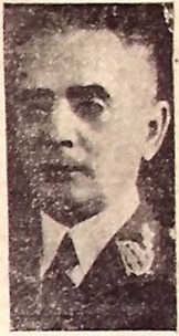
General Firmo Freire

das nossas forças armadas, exercerá até há pouco tempo as elevadas funções de sub-chefe do