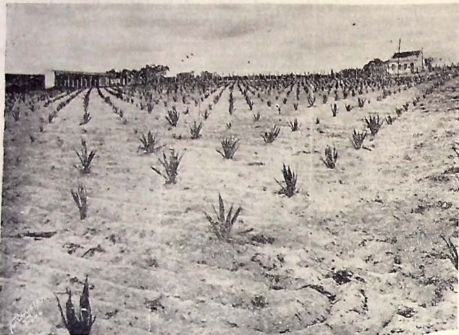
Vista parcial do plantio de agave do município de Campina Grande, em Bodecoço.

As matas aumentam a água das fontes, regulam o regime dos rios, enriquecem o solo, aproveitam terras pobres, inúteis a outras culturas.