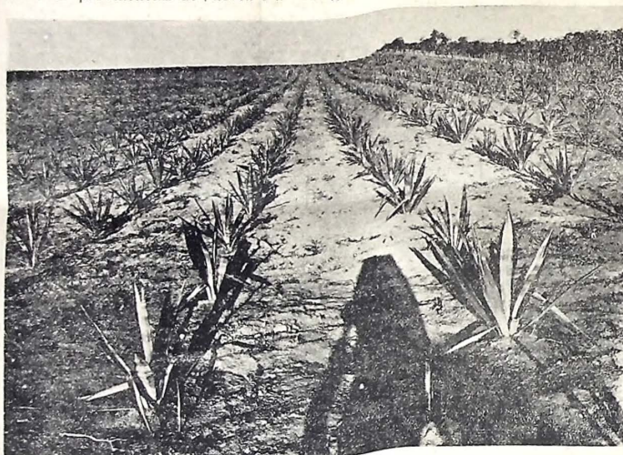
Campo de demonstração do município de Itabalana. Uma parte do agaveal

essa futura indústria, tomou duas providências de grande alcance: distribuiu, em massa, mudas de agave aos lavradores e a obrigatoriedade