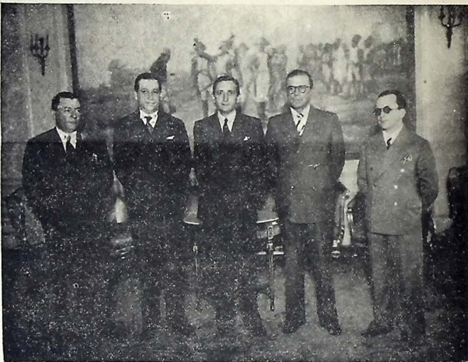
Fotografia tirada no salão nobre do Palácio da Redenção, durante a visita dos membros do Departamento Administrativo do Estado ao interventor Argenirio de Figueiredo