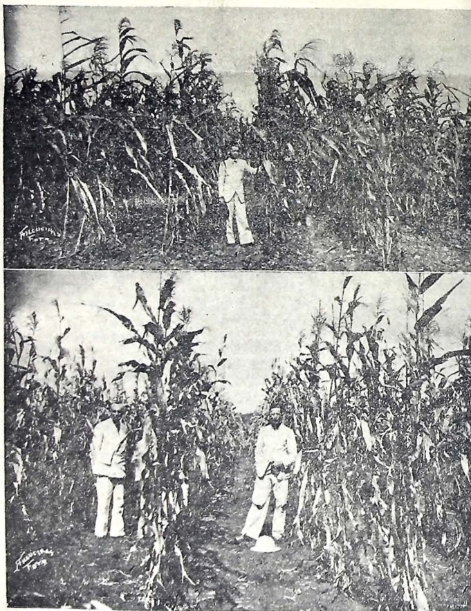
1 — Vemos, em cima, uma parte do milharal do campo de demonstração do município de Alagoinha Grande. Este campo além da ótima cultura que vemos, tem ainda outras áreas ocupadas com azeite, cebola, algodão e cana de açúcar. No clichê vê-se o sr. Inspetor Agrícola de Areia, agrônomo Paulo Alfeu de Miranda. 2 — A fotografia mostra um aspecto parcial da excelente cultura de milho do campo de demonstração "Insular" de 10 hectares, pertencente ao sr. Juvenal Espinola Filho, no município de Areia. Este campo, cuidadosamente preparado pelas máquinas, foi plantado de início, com feijão e milho, em cultura consorciada. Colhido o feijão, cuja safra (1.400 litros) deu para pagar todas as despesas e ainda sobrar um pouco, ficou o milho, que vai ser logo colhido para o imediato plantio da terra com cana de açúcar após cuidadosa sulagem. No clichê, em companhia do sr. Juvenal Espinola Filho, aparece o diretor de Fomento, agrônomo João Henriques da Silva.