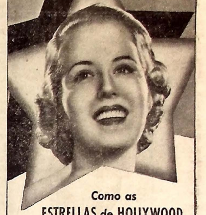
Como as ESTRELLAS de HOLLYWOOD

As estrelas de Hollywood sabem que a popularidade depende em grande parte de um sorriso atraiante que só se consegue com dentes brilhantes e alvos. A Senhora também pode ter dentes brilhantes e alvos usando KOLYNS, o creme dental moderno, recomendado por milhares de dentistas, devido ao seu poder de limpar verdadeiramente notável. KOLYNS produz uma limpeza melhor, mais eficaz e mais econômica. Experimente KOLYNS.