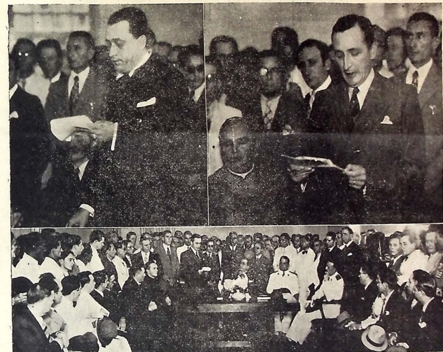
1) Aspecto apinhado no momento da instalação do Departamento Administrativo do Estado, quando falava o respectivo presidente, dr. Bôto de Menezes; 2) O interventor Argemiro de Figueiredo saudando os membros do D. A. E.; e 3) Flagrante gerat da solenidade, vendo-se a mesa que presidiu os trabalhos.

O Chefe Nacional participou ali de um churrasco oferecido em sua honra, por Governo do Estado do Rio, no qual tomaram parte várias personalidades de destaque, inclusive o interventor Amaral Peixoto, interventor interino Afrêdo Neves, interventor Landulfo de Almeida, além de Ministros de Estado e outras altas autoridades.