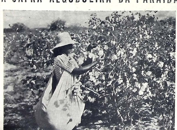
Campo de Cooperação "Santo Agostinho" Colheita de algodão mecô — (Serviço de Plantas Textéis).