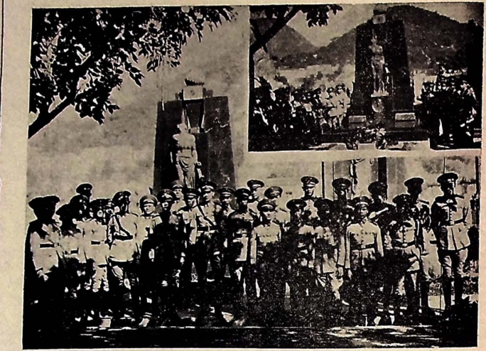
Dois aspectos da visita feita pela delegação da Polícia Militar do Estado ao túmulo do presidente João Pessoa na Capital da República. — (Reportagem em outro local da presente edição)