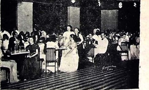
Dois magníficos aspectos do baile em comemoração do 53.º aniversário do Clube Astreia, realizado no último sábado, que constituiu uma nota de elegância com o comparecimento de destacados elementos da nossa alta sociedade