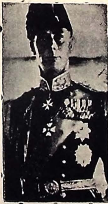
S. M. o rei Jorge VI

O "EMPRESS OF AUSTRALIA", ESCOLTADO PELOS COURACADOS "GLASGOW" E "SOUTHAMPTON" CHEGOU À ANTIGA CIDADE CANADENSE, ÀS 6,35 DE ONTEM — MILHARES DE PESSOAS ACLAMARAM SUAS MAJESTADES BRITÂNICAS — O PRIMEIRO MINISTRO MACKENZIE KING OFERECEU AO REI JORGE VI UM JANTAR DE 400 TALHÊRES — DISCURSANDO PERANTE COMPACTA MASSA POPULAR, O REI JORGE VI DECLAROU: "É ESTE UM MOMENTO HISTÓRICO, POIS, JAMAIS UM REI BRITÂNICO, DEPOIS DE COROADO, ATRAVESSOU O ATLÂNTICO PARA ESTE HEMISFÉRIO".