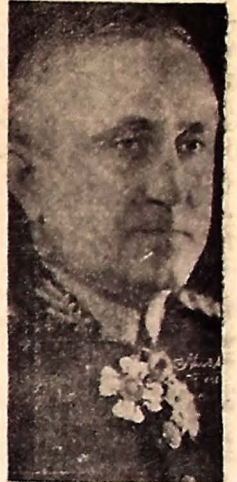
General Eurico Gaspar Dutra

Nas horas difíceis por que tem passado o Brasil, impressionou o País a pronta e resoluta energia do titular da Guerra enfrentando heroicamente as hostes da subversão e da desordem, com a coragem, a decisão e o patriotismo dos autênticos chefes militares. Homem de uma nobre e íntegra formação moral acrisolada no austero ambiente da ca-