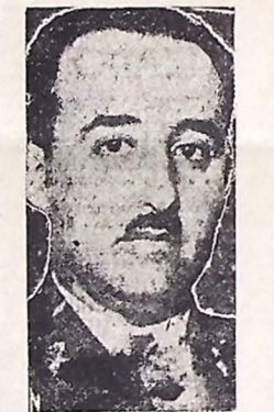
Generalissimo Franco, chefe do governo espanhol, cujas tropas deverão, segundo os últimos despacho, entrar, hoje, em Madrid

BURGOS, 24 (A UNIAO) — Por ocasião da apresentação das credenciais do embaixador francês, o marechal Petain pronunciou importante discurso, salientando os laços de amizade que unem a França à terra espanhola, terminando por desejar a