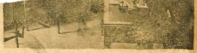
Outro aspecto da redacção

... precipuamente ... mentira, a mal- ... brutalidade, a ... fundo do seu car- ... quem mais do que ... de cuidado, de ... verdade, casos em ... não existe senão ... e a instabilidade não ... os hábitos incutidos nas ... por excessos de zimbos, ... por vezes fácil de provar em ... normal é um doente, prova- ... vemente curável mas doente. Lem- ... bro-me bem de um instável, collega ... me, angustia dos mestres e conta- ... todos nós, seus condiscipu- ... que se suicidava aos quinze an- ... amado subitamente de uma ... paixão precoce. ... arremear água suja dos sobra- ... e o ... do vizinho por traz dos postigos ... ... O espírito de destruição, que vai ... nas plantas, assentes da arboriza- ... cidade, a actuação do insatis- ... pelo casarão, quando desaparecia e ... dançantes os bancos das praças pu- ... blicas; a vesania do garoto por- ... ceppo que hesita de obscenidades ... os muros e as casas recentemente ... pintados; a descortesia e ausência ... de agrado, assédio e sinceridade em ... algumas casas de commercio, abor- ... ta a frequência de famílias; a falta ... de respeito aos velhos e ao decoro ... devido às crianças; a licenciosidade ... e desobediência da imprensa nos ... poemas e bonitos, fundados em ... felleo, e nestes uma repulsa ao ... proprio das casas de abito não ... pontos estes que têm sempre sido ... destruídos pela imprensa regional, ... forçada a inventar as suas funções ... eminentemente civilizadoras. ... Antes da Republica, a imprensa