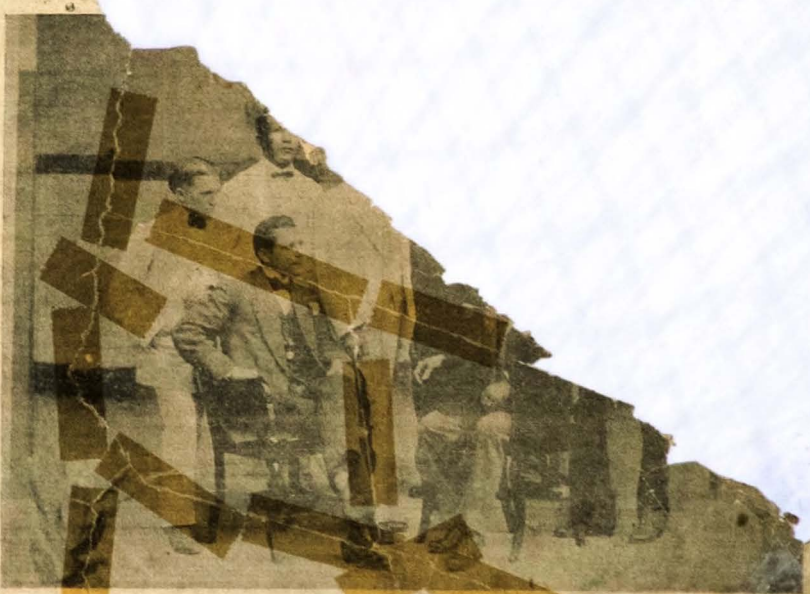
Redactores e administradores d' "A UNIÃO"

formas in- zem, animadas de viver e amar, aos hombros os e dosos e reas com atados por uma li roiam na sua queda aguis cascateantes, so desfilam e escorres aspecto de uma nymph uma fonte aromal. As diaphanas, em repouso n