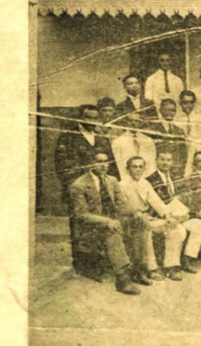
Corpo de operarios d' "A UNIAO"

As constipações que são tão perigosas curam-se com o uso do Vinho Cerecolado do pharmaceutico chimico Silveira.