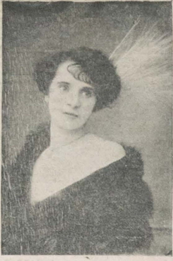
A atriz de Fievert