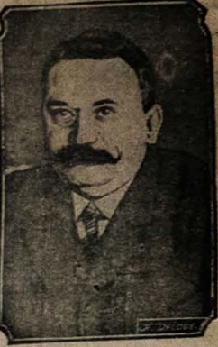
M. G. Doumergue, Président du conseil des ministres de France.