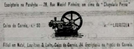
Escritorio na Parahyba—28, Rua Maciel Pinheiro, em cima da "Chapelaria Pensa" Caixa do Correio, n.º 50 Filial em Natal, Lauritzen & Leite, Caixa do Correio, 24. Escritorio na Praça do Correio.

Motores, locomoveis, descaroçadores, installações para descaroçamento de algodão, moagem de canna etc.