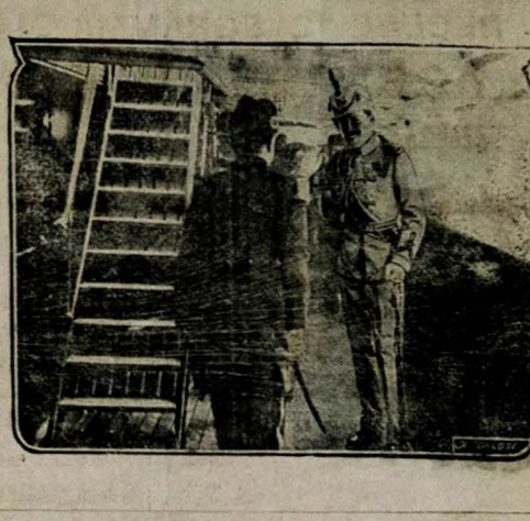
Estado da Parahyba do Norte

Este proposito do nosso governo tem absoluto cabimento como medida prophylactica de saúde, num momento em que se está elaborando um verdadeiro sistema de vacinas, que periodicamente annua em todas as partes do corpo humano, sem o menor prejuizo a saúde.