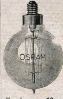
Vendem a 1$800 NAVARRO & C.ª

São as mais economicas e mais resistentes.