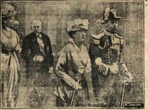
O rei da Inglaterra e Mme. Poincaré, Mr. Poincaré e a rainha