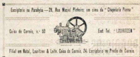
Escritorio na Parahyba—28, Rua Maciel Pinheiro, em cima da "Chapelaria Penna" Caixa de Correio, n.º 50 End. Tel. "LAURITZEN" Filial em Natal, Lauritzen & Leite, Caixa de Correio, 24. Escritorio no Predio de Correio.

Motores, locomoveis, descaroçadores, installações para descaroçamento de algodão, moagem de canna etc.