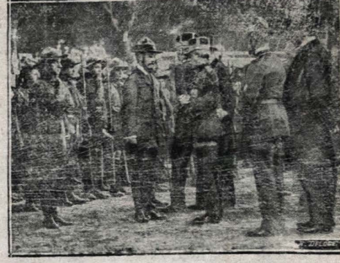
A entrega da bandeira das açoes aos boys-scouts da Belgica. O general Vanwermans, conversando com o chefe dos scouts.

Os camarotes com cinco ingressos, podendo aliar-se a entrada de ingressos em numero razoavel, custarão 4800 e de bilhetes respectivos terão apenas um pequeno coupon de 300 rs. em beneficio do