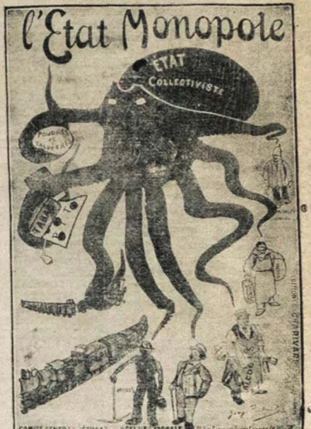
As eleições na França.—Um dos mais interessantes cartazes políticos que foi affixado por todo o País. É o periodo eleitoral que começa...