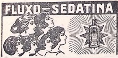
REGULADOR E CALMANTE DAS SENHORAS